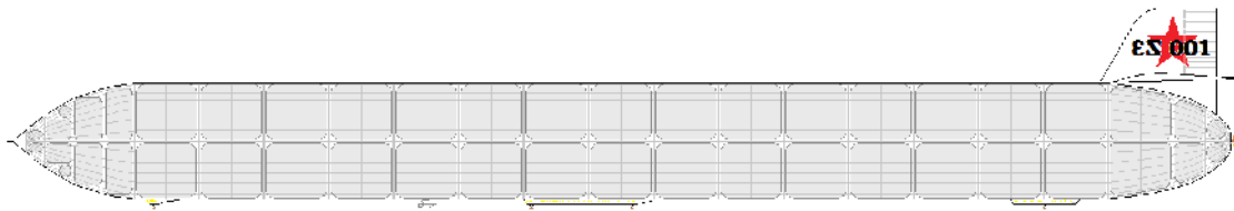
vue en coupe - répartition des ballons de gaz